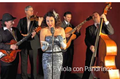
Viola con Pandrinos